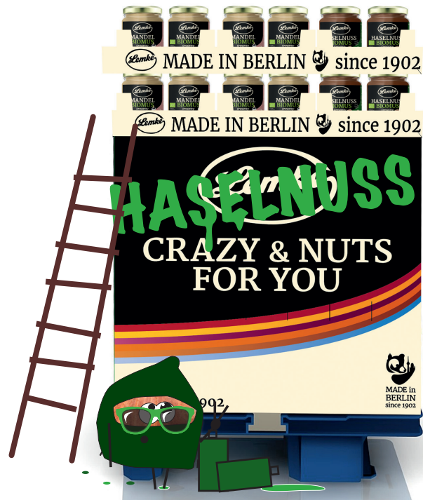
Musteransicht | Sample Basic Display