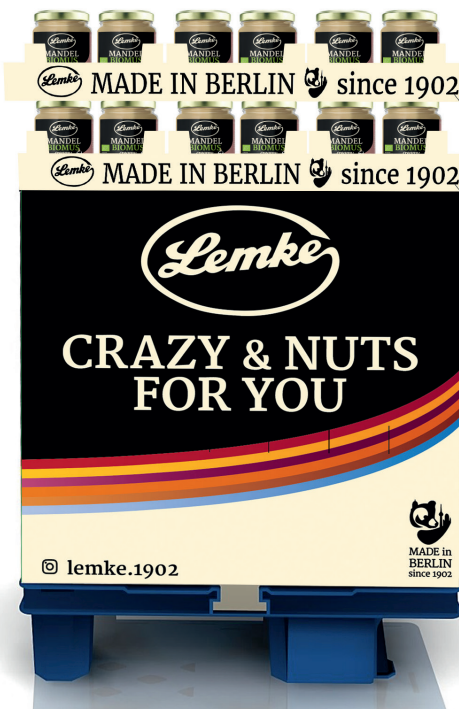
Musteransicht | Sample Basic Display